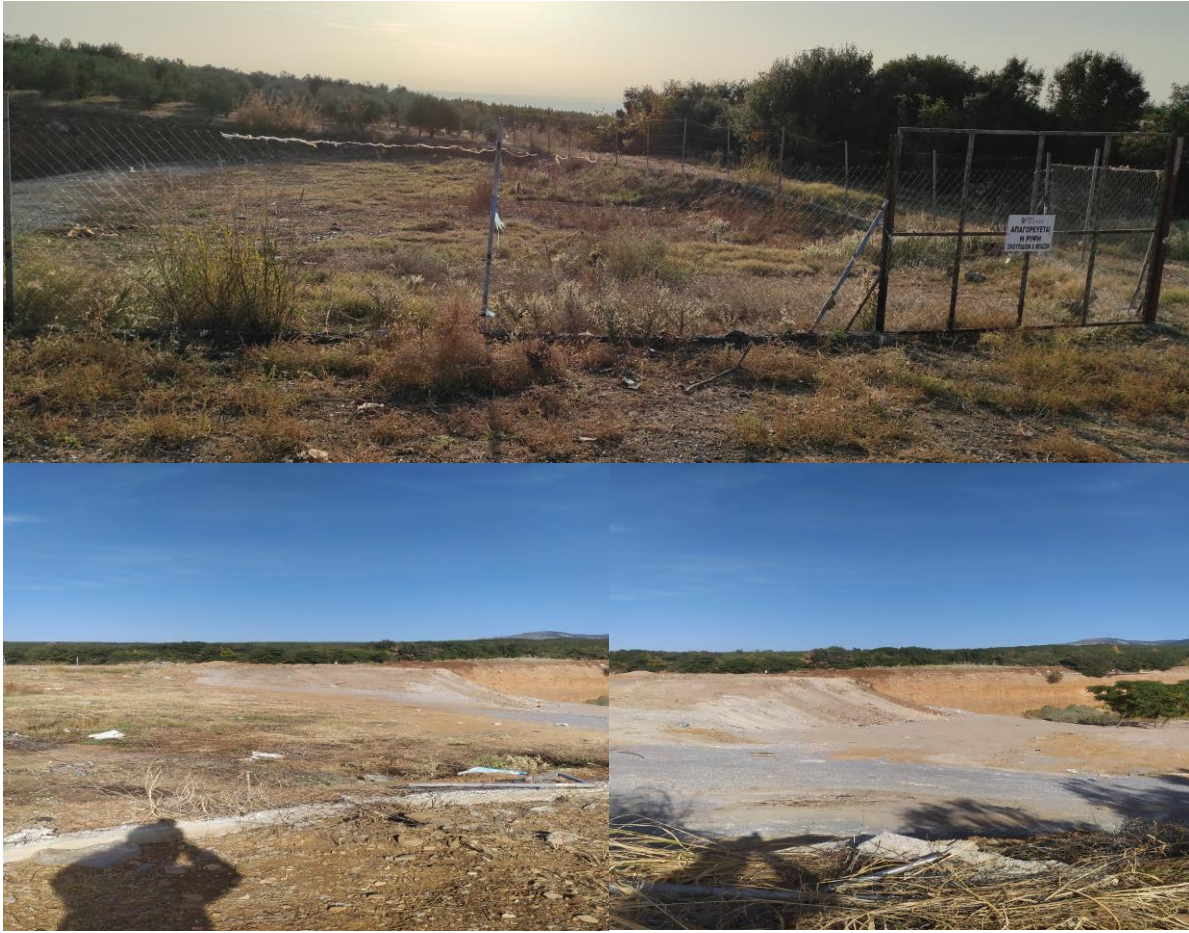
ΕΙΚΟΝΑ 2.: Χώρος αγροτεμαχίου (Αυτοψία 02-11-2022)